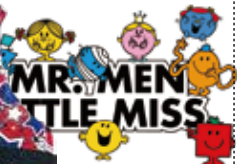
MR. MEN LITTLE MISS