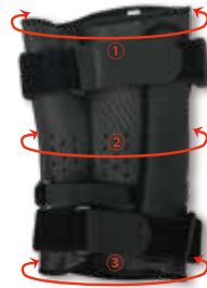
ヒンジは内側にスクリュー内蔵