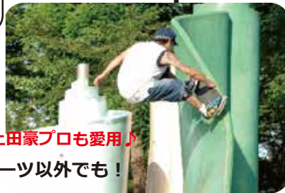
プロスケーター上田豪プロも愛用!