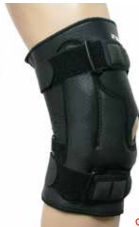
ヒンジは内側に スクリュー内蔵