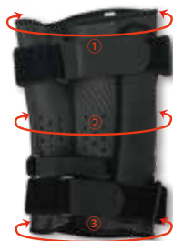
ヒンジは内側に スッキリ内蔵

有穴ウェット素材!! ボディーのウェット素材 に小さな穴が開いていて 通気性抜群!