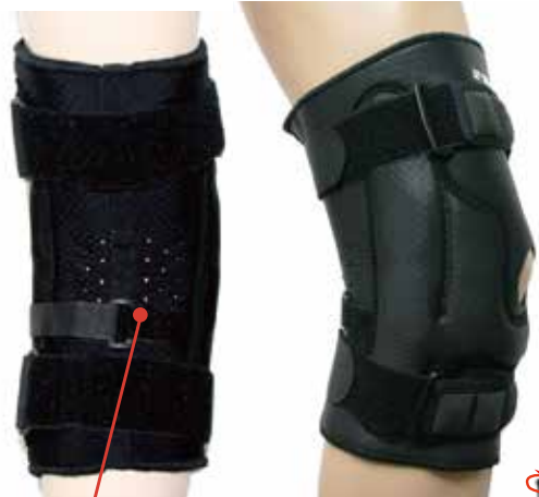
3rdベルト 本体のスレを防止します!