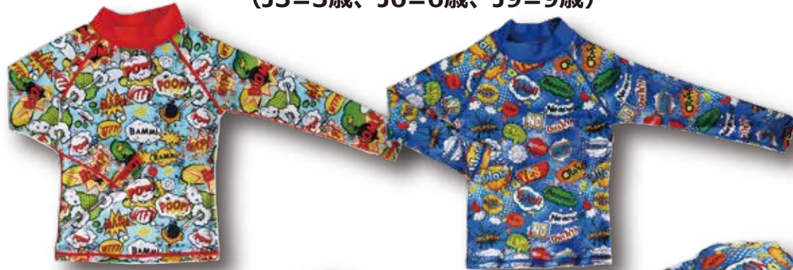
カラー： Pow Red