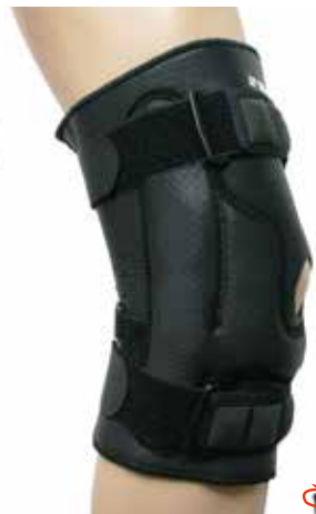
ヒンジは内側に スクリュー内蔵