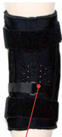
3rdベルト 本体のスレを防止します!