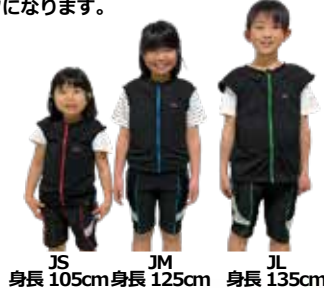
JS 身長 105cm JM 身長 125cm JL 身長 135cm