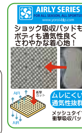
AIRLY SERIES ALL SEASON ALL SPORTS www.yoroi4p.com