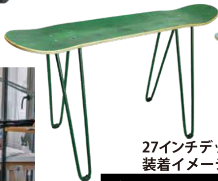
27インチデッキ 装着イメージ

重量:1.2kg 高さ:約40cm 【付属品】 1インチカラービス キズ防止キャップ