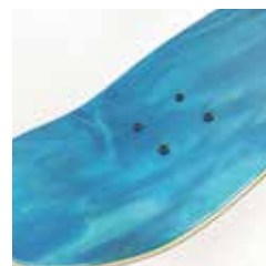
①デッキにネジを取り付ける (セロテープ等でネジを固定すると便利)