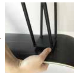
②裏返して脚を付ける