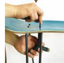
④スケボーレンチでネジを しっかり固定する。