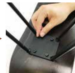
③ナットで軽く固定する