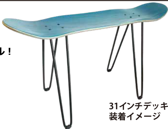
31インチデッキ 装着イメージ

使わなくなったデッキを チェアにして アップサイクル！ おしゃれなインテリアに。 SDGs を考えた商品です。