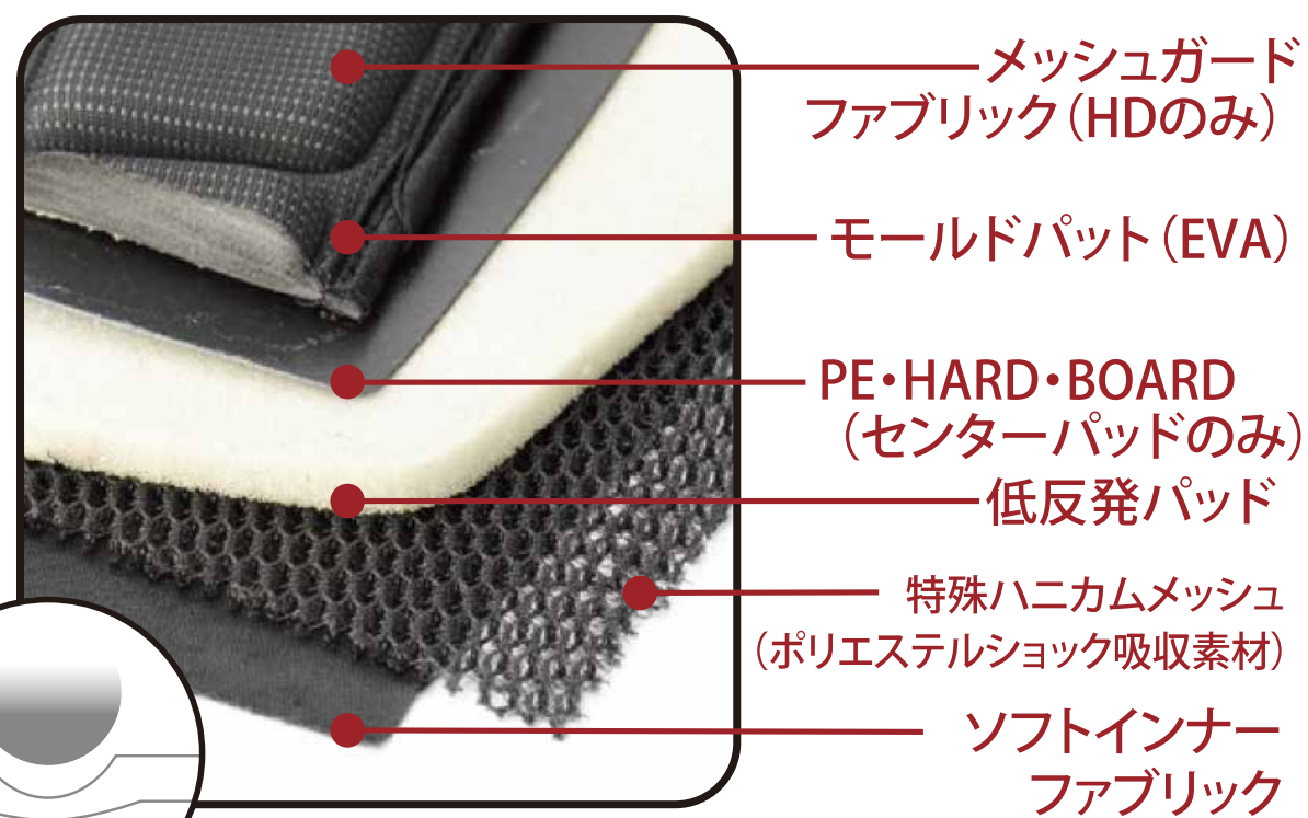
衝撃カットイメージ